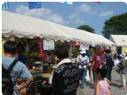
<暑い日差しの中、屋台も大盛況>

7月27日(日)、上笹下地区の第14回「ザ・まつり」が上中里地区センターで開催されました。