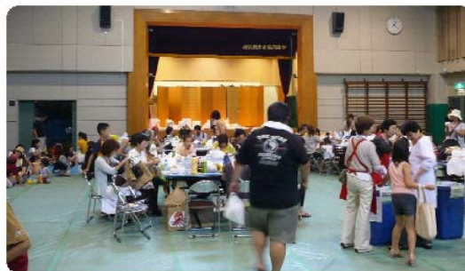
<体育室もおおにぎわい>

また、屋内の体育室では、子ども会による釣堀・輪投げなどのアトラクションが大人気で、小学校最後の夏休みを迎えた、6年生のお兄さん・お姉さん達も、大人に混ざってアトラクションの受付をがんばっていました。