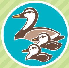
カルガモ・カールズ (区の鳥)