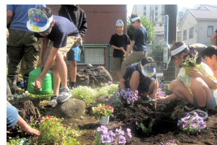
フラワーメイトジュニアによる花の育成 (花薫るきれいな街ほどがや事業)

★その他の事業・取組については、令和8年度保土ヶ谷区予算・主要事業のページをご覧ください。 (ホームページ： https://www.city.yokohama.lg.jp/hodogaya/kusei/unei-hoshin-yosan/yosan/ )