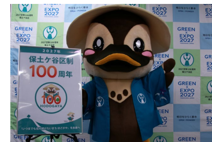
区公式マスコット・100周年ロゴマーク (区制100周年事業)