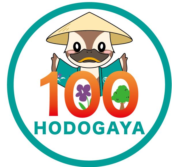
保土ヶ谷区制100周年ロゴマーク