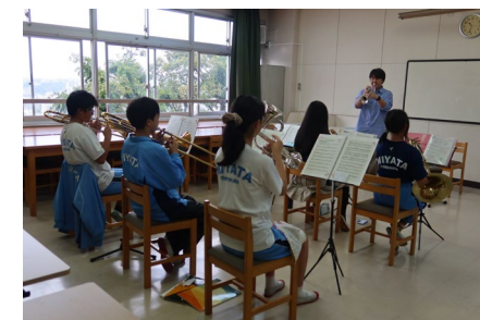
神奈川フィルハーモニー管弦楽団 によるワークショップ (こどもが主役！地域の魅力体験事業)