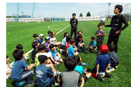
横浜FCとの連携事業 (こどもが主役！地域の魅力体験事業)