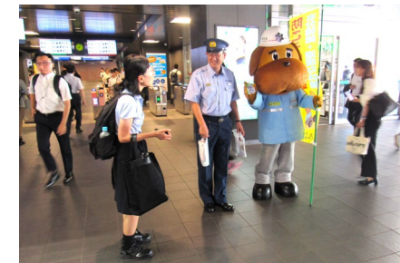
関係団体と連携した熱中症対策啓発 (災害対策推進事業)