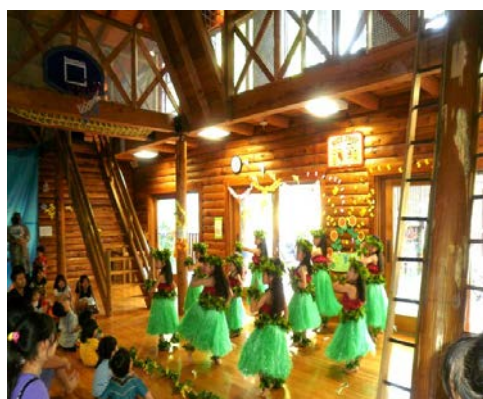
フラダンススクール（上星川）の発表会の様子