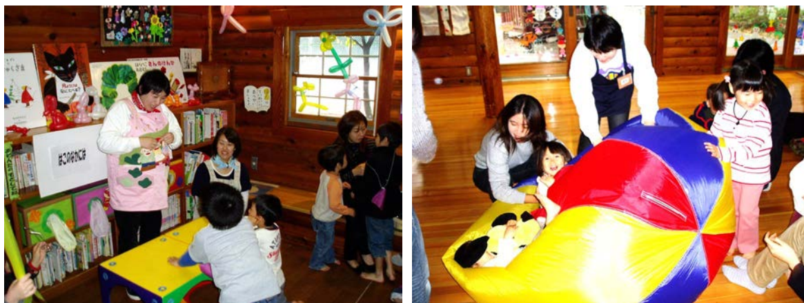
【写真】研修で学んだことを活かし、来館するこどもたちの目線に合わせた対応を心がけています。

全職員が年1回、人権研修を受講し、「相手の立場に立って考える」を基本に利用者満足度の向上を目指しています。