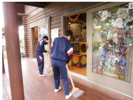
西谷中学校2年生「職業体験」の様子

実際に仕事を体験してもらうことで、今後の進路を考える一助になればと、体験場所として当ログハウスを提供しました。