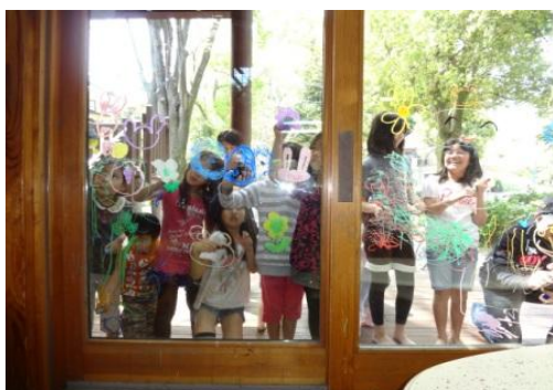
H24年4月実施自主事業 「まどにお絵かき」の様子

こどもは、遊びを通じて自分の得意なもの、好きなこと等色々な発見をし、知識を身につけていきますが、まだ無限の潜在的可能性を秘めているといわれます。その潜在的可能性を引き出す契機の一助として、こども達の興味や関心を喚起できる自主事業を企画・実施し、こども達の創造性や感性に刺激を与え成長を促すことを狙いとします。