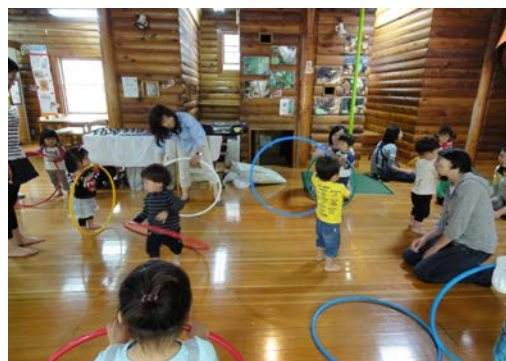
H23年5月実施自主事業 「親子リトミック教室」の様子

ログハウスの大きな窓ガラスにこども達が伸び伸びと絵をかく、ログハウスで人気の自主事業です。