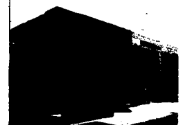
指定管理施設：横浜市白幡地区センター

旧法における委託業務でありましても、指定管理者でありましても、公共施設の品質高い運営を行う事を以って生業とするのがアクティオでございます。即ちあまたある業務の内、一部のマイナー業務として指定管理者業務を行うのではなく、弊社に取りましてはまさに中核業務なのです。さてこの中でも地区センターは弊社の最大注力施設と位置付けております。それは(ア)項で既述申し上げました事に加えまして、私どもは実際に神奈川区様の白幡地区センターにおける指定管理者として選定を賜り、約1年間がんばってまいりまして、多くの皆様からご支持や励ましを頂く事が出来ました。まさにご利用者の生のお声であり、大変ありがたく励みにもなっております。こうした意味からも、私どもは地区センターを指定管理者業務の基本母体と致したいと願っており、極めて重要な位置付けの施設と考えております。