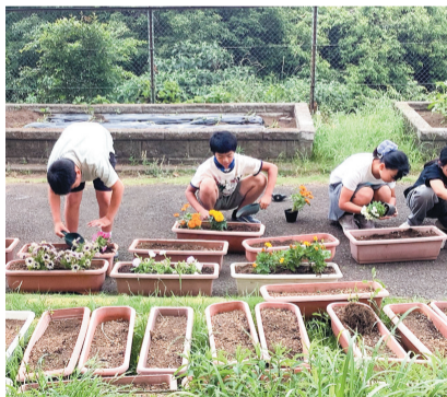
苗をプランターに植える児童