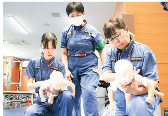
◀乳児がどに 詰ませた時 の対応訓練