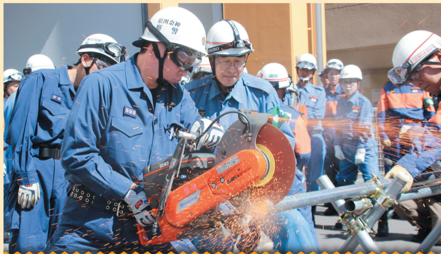
保土ヶ谷消防団と保土ヶ谷警察署が合同で災害時資機材訓練を行っています。 【消防団員募集中!詳しくは9面へ】

区民の皆さんが安心を実感できるまちをつくるため、行政機関は地域と互いに力を合わせています。今年度も「ワンチーム」となり、地域の安全を守る取り組みを進めています。