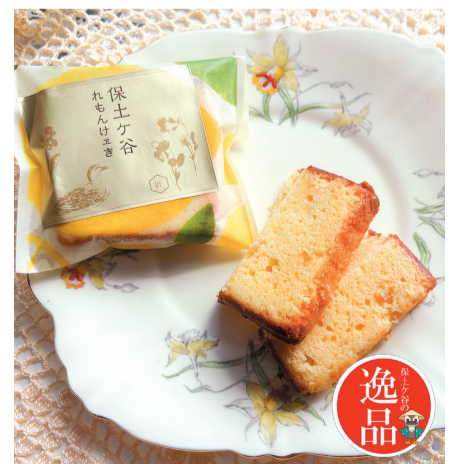
「保土ヶ谷の逸品」認定商品