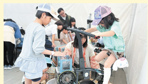
専用機械でペットボトルキャップを粉砕