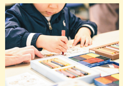
防災マップでアート作品作り