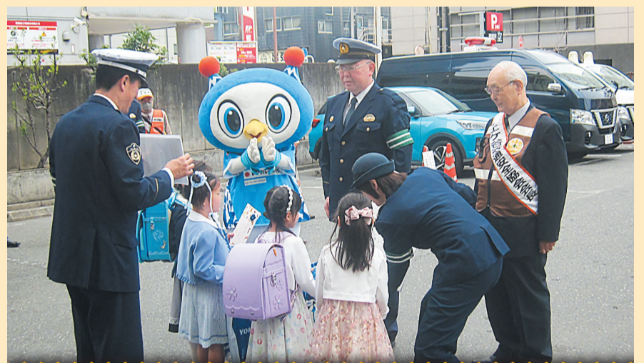
保土ヶ谷警察署と交通安全協力団体が力を合わせ、一年を通して交通事故防止運動を実施しています。