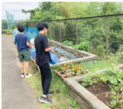
水やりをする児童