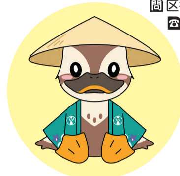
保土ヶ谷区マスコット ほどぴー