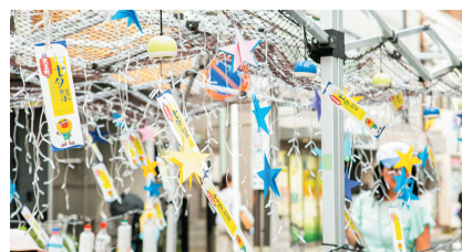
にぎやかな七夕祭