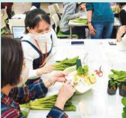
植物を楽しむワークショップ