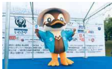
企業ロゴ掲載やブース出店など豊富な特典メニュー