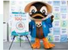
◀ 区マスコット・区制100周年ロゴマーク