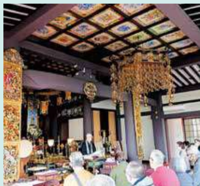
地元の歴史を学ぶ(香象院)