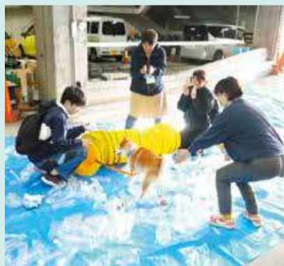
災害時のペット避難疑似体験