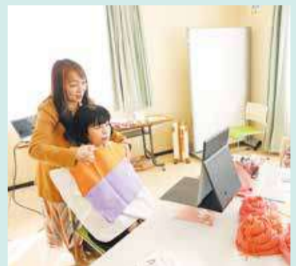
パーソナルカラー診断