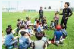
◀ 横浜FCによる子ども向け教室