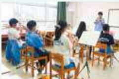
◀ 神奈川フィルハーモニー管弦楽団によるワークショップ