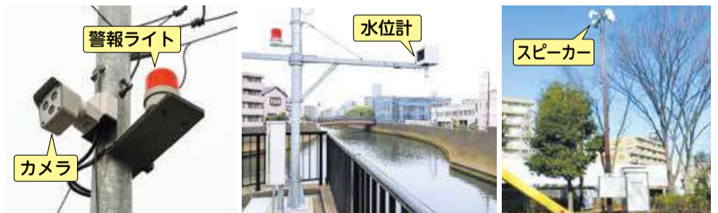
水位が160cmを超えた場合に、警報ライトが点灯・回転し、サイレンを鳴らします。