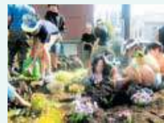
◀ フラワーメイクトジュニアによる花の育成