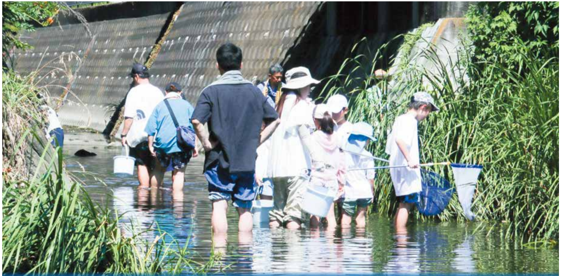
国道1号線沿いの瀬戸ヶ谷橋から保土ヶ谷橋間を活動エリアとする「保土ヶ谷宿松並木プロムナード水辺愛護会」では、河川清掃のほか、近隣の子もたちが参加する河川の生き物調査などを行っています。

身近な川は、子どもたちが自然に触れ、学ぶことができる大切な場所です。一方で、大雨のときには水位が急に上がることもあります。市では、川の水位を見守る仕組みや、安全に親しめる環境づくりを進めています。皆さんも、天気や川の変化に気を配り、安心・安全に川で遊びましょう。