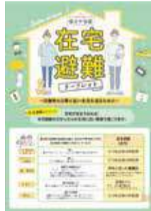
在宅避難リーフレット