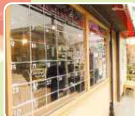
二つ台みーとみーと

多世代交流拠点「二つ台みーとみーと」を運営しながら、地域の「やってみたい」を形にできる場づくりに取り組んでいます。