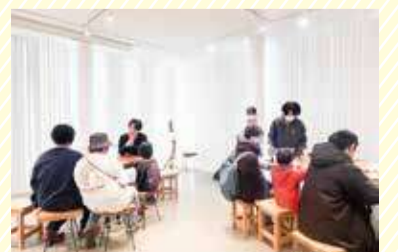
防災啓発イベントの様子

今後も区役所や地域と連携し、複数のチームが生み出す研究成果やアイデアを発信することで、地域の防災力をさらに高めていきたいと学生たちは意気込みます。「何よりも、楽しみながら活動することを忘れない」。その笑顔が、地域に防災の輪を広げています。