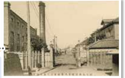
富士瓦斯紡績株式会社 保土ヶ谷工場正門 横浜都市発展記念館所蔵

1939年建築。ステンドグラスが美しくきらめき、細かいところまで手の込んだ建物です。