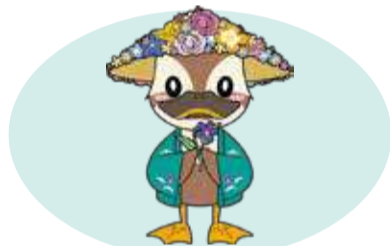
保土ヶ谷区マスコット ほどぴー

1月23日(金)9時30分～(売り切れ次第終了) 区役所前広場 直接会場へ(雨天中止。マイバッグを持参) 企画調整係 334-6228 333-7945