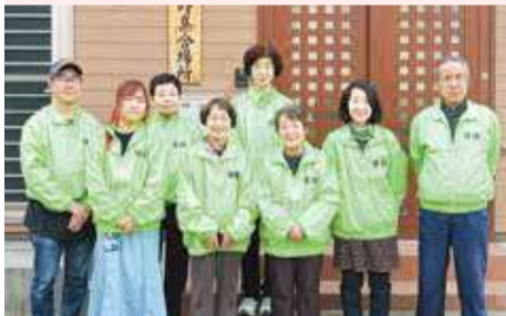
瀬戸ヶ谷町自治会 家庭防災員の皆さん

地域のイベントで災害時の備えなどを啓発するとともに、地域防災の担い手づくりにも取り組んでいます。