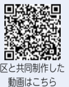
区と共同制作した動画はこちら