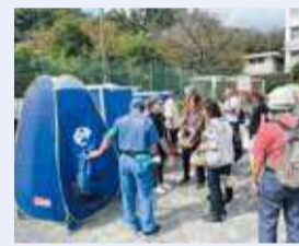
各地域防災拠点では訓練を実施しています

地域の皆さんが無理なく活躍できるよう、コミュニケーションを大切にして防災活動に取り組んでいます。