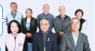
災害ボランティアネットワークの皆さん

学外への情報発信と地域連携を通して、防災意識の向上を目指した活動を展開しています。