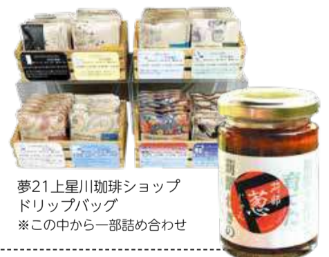
夢21上星川珈琲ショップ ドリップバッグ ※この中から一部詰め合わせ