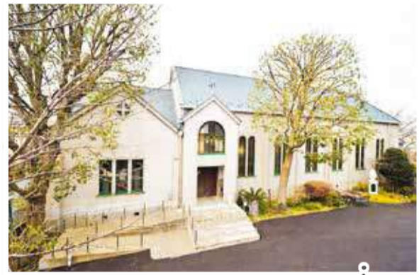
保土ヶ谷カトリック教会

区内には、旧東海道保土ヶ谷宿や工場跡地・洋館など、歴史的で魅力ある建物・遺構などが数多く残っています。 そんな保土ヶ谷区の歴史を感じるスポットを紹介します！