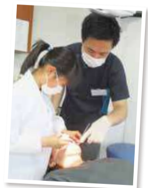
歯科医師体験の様子