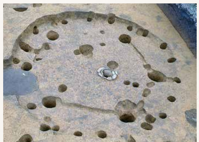
南原遺跡2号住居址

その後、寒冷な旧石器時代から温暖な縄文時代へと移り変わり、それまでの遊動生活からイエがつくれる定住生活が始まります。南原遺跡では、約1万年前(縄文時代早期)につくられた半地下式の竪穴住居跡が2軒発見され、約5,000年前(縄文時代中期)の竪穴住居跡(右写真)は50軒以上見つっていることから、人々が台地上に集落を営んでいたことがわかります。気候が温暖になり、帷子川流域に自然豊かな森が広がるなか、そこからもたらされる恩恵に与りながら狩猟・採集していた当時の生活が垣間見えます。