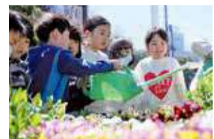
区内小学校での花の育成