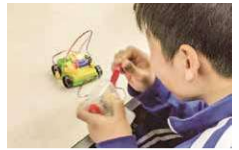
エコカー工作風景(イメージ)