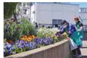
区民ボランティアによる花壇整備