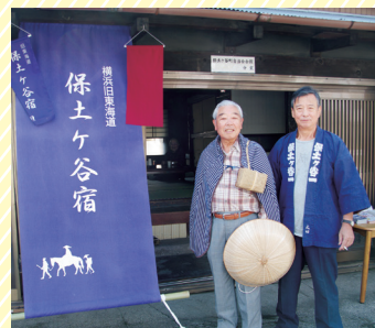
のれん 暖簾股旅姿になって 当時の気分を味わえます

コロナ禍で休館している期間もありましたが、今はまちあるきで訪問する人が増えているお休み処。6月は約100人も人が訪れたそうです。「一度始めたら継続することが大事。スタッフ自身が楽しく活動を続けていけるように、会長として声掛けや雰囲気づくりを意識して行っていきたいです。また、今後に向けて、開館日を1日でも増やしたり、保土ヶ谷宿の歴史を分かりやすくまとめたパンフレットを作成できたらいいなと考えています」と、今の思いを力強く笑顔で語ってくれました。