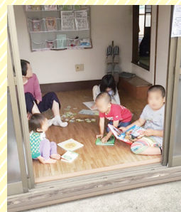
子どもたちも 自然と集まれる居場所