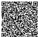
▲電子申請 システム