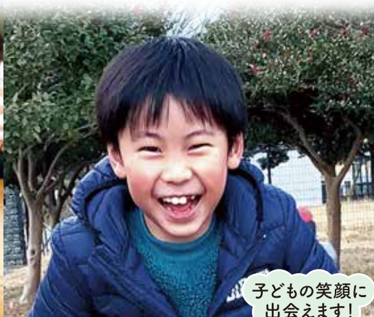
子どもの笑顔に 出会えます!