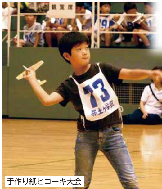
手作り紙ヒコーキ大会