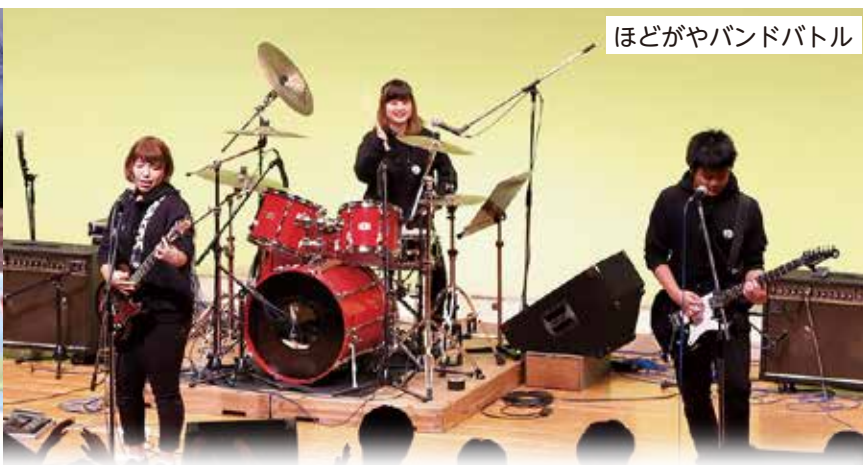
ほどがやバンドバトル