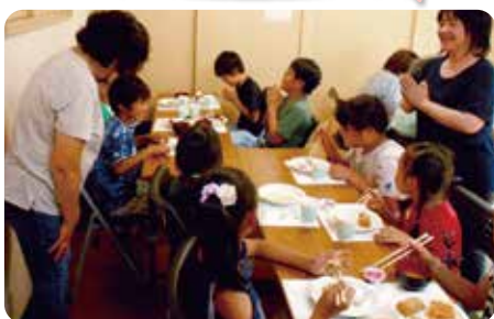
▲子どもから高齢者まで仲良く集います