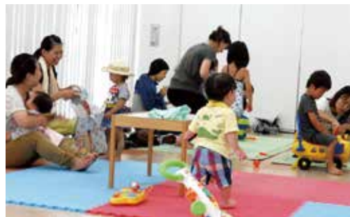
▲子育てサロンほのぼの(川島東部地区)

2022年5月に自治会町内会へ推薦を依頼します。12月に厚生労働大臣から委嘱されます。(任期は3年) 関心のある人は、区民生委員児童委員協議会事務局(区役所運営企画係)にご相談ください。