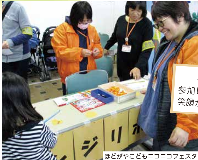
ほどがやこどもニコニコフェスタ