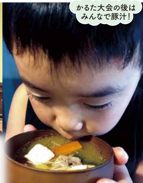
かるた大会の後は みんなで豚汁!