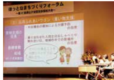
令和元年度の活動発表