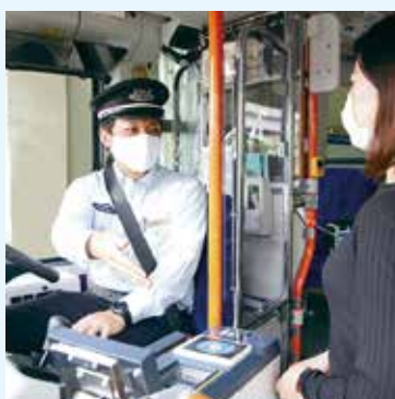
帽子の白いラインが マスタードライバー*の証。

やはり「ありがとう」の言葉をもらったときです。その一言で緊張がほぐれ、「無事にお送りできた」という安心と、「もっと頑張ろう」という意欲につながります。