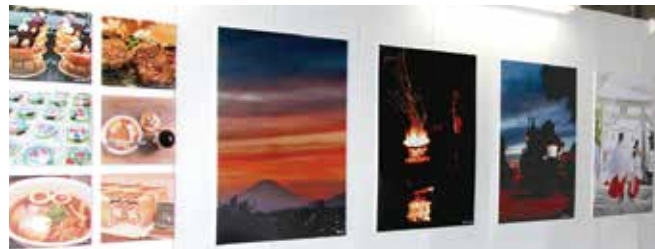
8月には星川駅で開催しました!