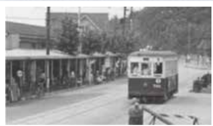
保土ヶ谷駅東口を走っていた市電(1954年)