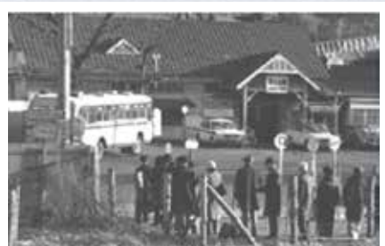
〔区制90周年記念誌より〕