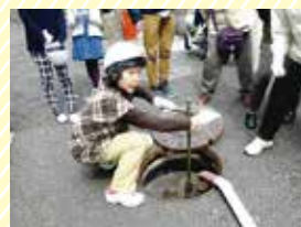
毎回多くの人に参加する放水訓練(平成29年度実施)