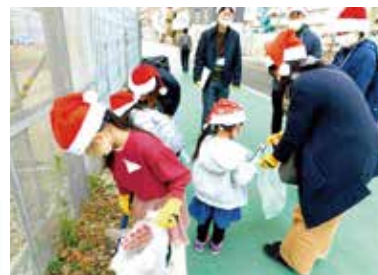
令和2年度に実施した「おそうじサンタ」