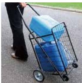
ポリ容器とカートで運搬

災害時給水所に容器の準備はありません。水を入れる容器と運ぶ道具を用意し、災害時給水所から自宅までの道(階段や坂があるかなど)を確認しましょう。