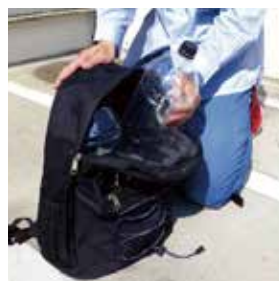
洗浄したペットボトルとリュックサックを利用