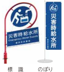
標 識 のぼり