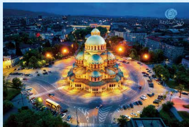
▲ソフィア市のアレクサンドル・ネフスキー大聖堂

ブルガリア共和国 首都：ソフィア市 面積：11.09万km 2 (日本の約3分の1) 人口：約698万人 (2019年) 言語：ブルガリア語