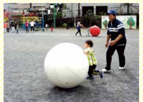
子どもから大人まで楽しめる地区の運動会

「家族や周りの人の支えがあり、ここまで活動を続けることができました。改めて感謝の気持ちを忘れず、委員同士協力しながら伝統を守っていきたいです」と今後の活動について熱い想いを話してくれました。