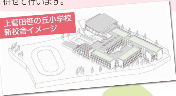
上菅田笹の丘小学校 新校舎イメージ

誰もが、駅などの施設利用や移動を円滑に行えるよう、一体的にまちのバリアフリー化を進める基本構想を策定します。