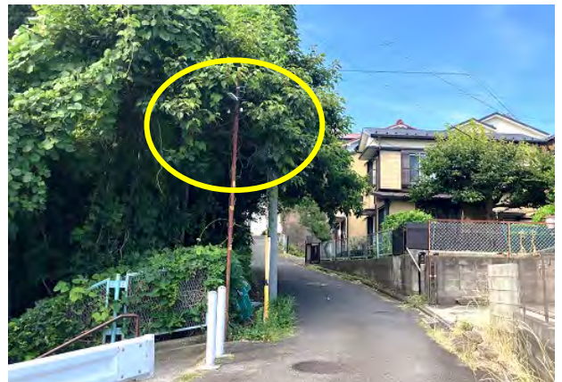
反対側から（防犯灯）