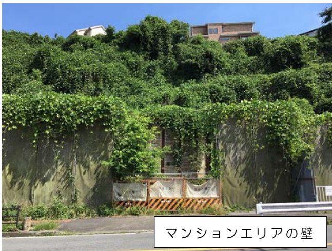
マンションエリアの壁