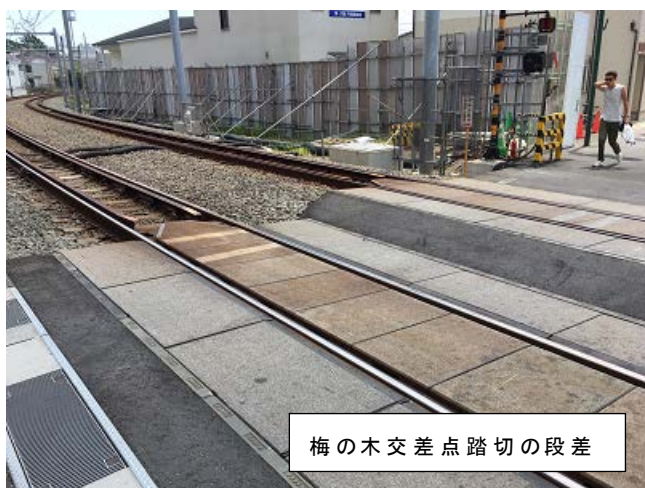
梅の木交差点踏切の段差