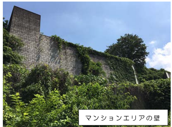
マンションエリアの壁

※8/16 現在建築局違反对策課（045-671-3974）で対応している。雑草伐採等の環境整備については、地域の声として所有者へ伝えるとの事、その他、何らかの動きがあれば区役所区政推進課（045-334-6227）に連絡が入ることになっている。