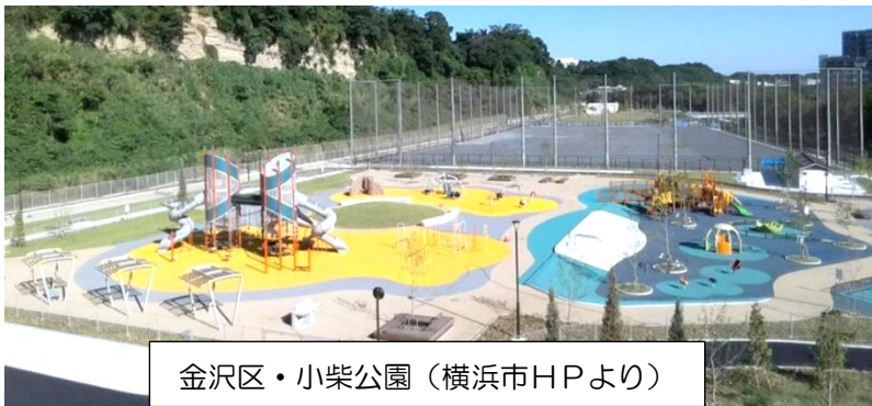
金沢区・小柴公園（横浜市HPより）

障がいの有無にかかわらずだれもが遊べる「インクルーシブ公園」（小柴公園）が金沢区に出来たとお聞きしました。保土ケ谷区でもぜひ造っていただきたいです。障がい児が遊べる場所が無くて本当に困っています。例えばブランコなど遊具一つでもあれば地域で遊ぶことができます。