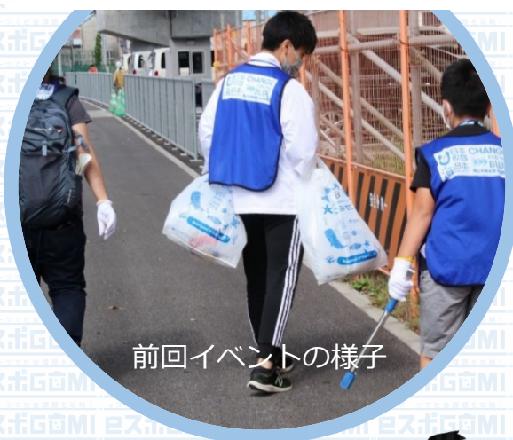
前回イベントの様子