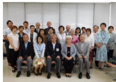
（介護相談員と区長で記念撮影）