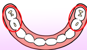
奥歯のかみ合わせ