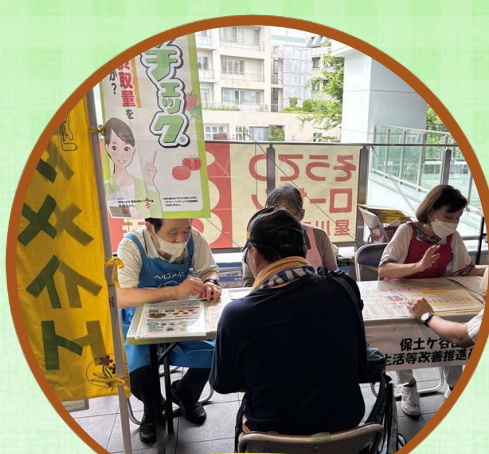
食事バランスチェック・ベジチェック®