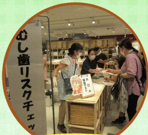
むし歯リスクチェック