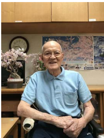
<よつば苑ご利用者様>