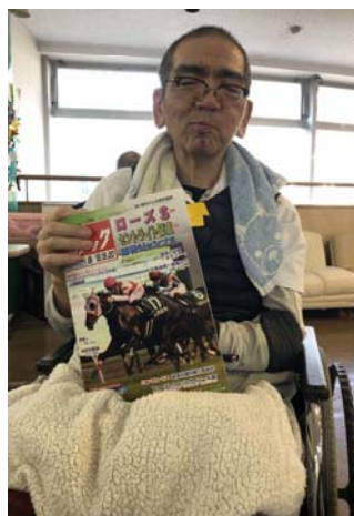
<夢の里ご利用者様>

質問に答えて下さった方は、普段から人一倍健康に気を付けている方とのことです。(写真)