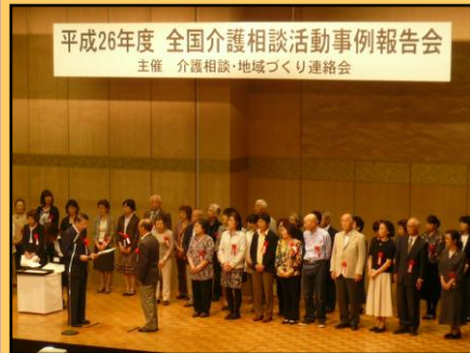
平成26年度 全国介護相談活動事例報告会 主催 介護相談・地域づくり連絡会