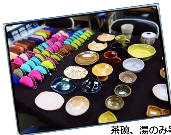
茶碗、湯のみ等 (11月3日販売)

このほか、かりんとう、豆腐、ストラップ、小皿、コースター等の販売を予定しています。