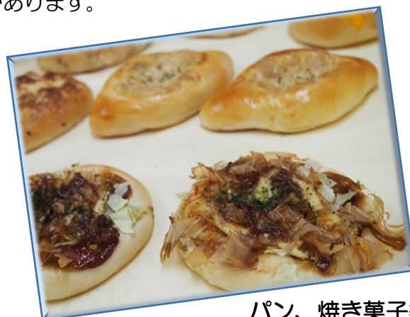
パン、焼き菓子等 (11月1日販売)