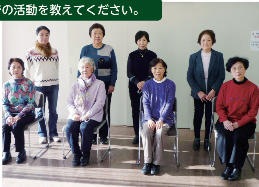
中央地区協力員(令和3年1月時点)の方々