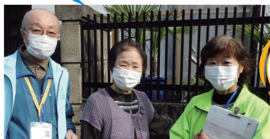
民生委員(左)と協力員(右)、訪問対象の方

協力員とは 地域からの推薦により区長に委嘱され、担当民生委員の活動を補佐する役割を担い、調査事務など民生委員に限られた活動以外を補佐・補助しています。