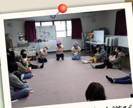
距離を取りながら室内遊び