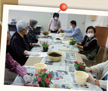
鉢の植え替えなどの交流

ある回では簡単な体操の後、園芸療法士を招いて花の植え替えを楽しみ、一人一つの鉢とお弁当をお土産として持ち帰ってもらいました。