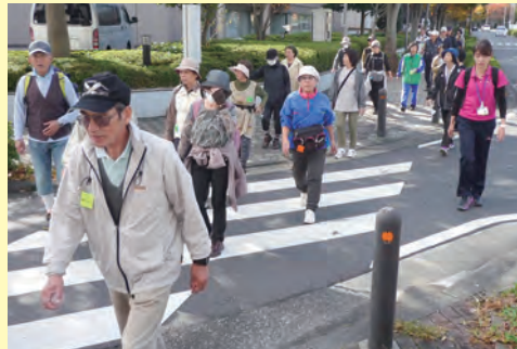
<ウォーキング教室>