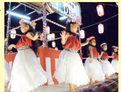
<盆踊りフェスティバル>