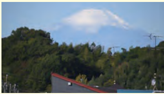
権太坂から望む富士

そのしるしに木の標識を立てていたのが境木と言われました。境木は権太坂など坂がたくさんあったので、東海道の中では箱根の次の難所とされました。現在の境木地蔵尊あたりで一休みすると、西に富士山、東に江戸湾を望む景観が素晴らしく、この場で癒されたことでしょう。