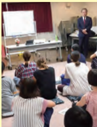
母親ネットワーク