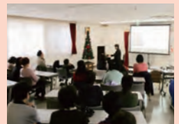
クリスマス音楽会