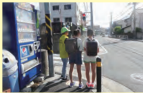
登下校の見守り活動