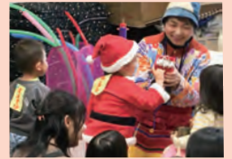
チューリップ(子育てサロン)