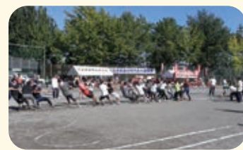
地区連合の運動会