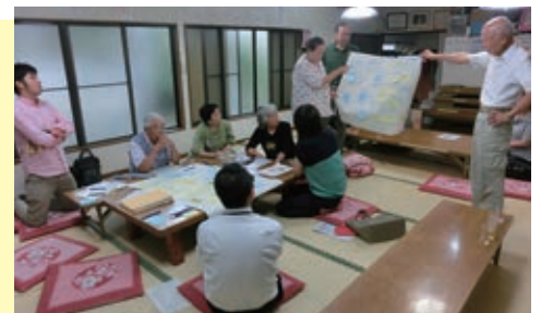
「保土ヶ谷中地区をちょっと楽しくする会」の検討の様子

これからの5年間で、少しでも具体的な取組の実施につなげられるよう、自治会との連携を深めながら、引き続き検討を進めていきます。