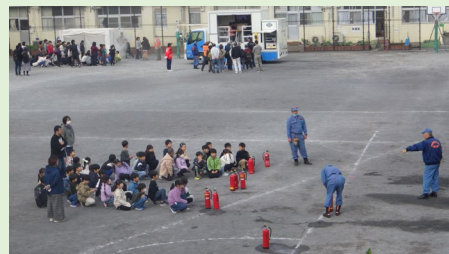
放水訓練、起震車体験など