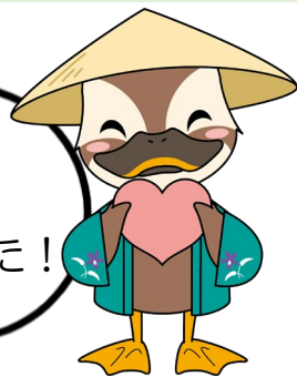
保土ヶ谷区マスコット ほどびー