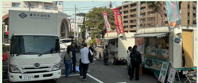
2/28(土) 防災講演会にてキッチンカー出店