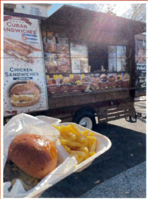
Red Barn Cafe (スマッシュバーガー)