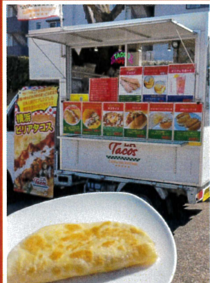
LA Tacos カリフォルニアキッチン (ピリアタコス)