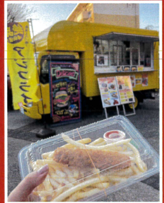
銀座六丁目、フライの家。 (フィッシュフライバーガー)