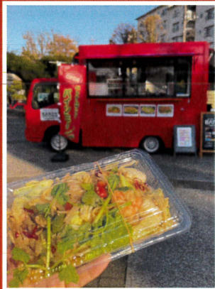
VTN KITCHEN BANDS (ベトナム料理)