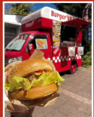
BK JACK (ハンバーガー・おにぎり)