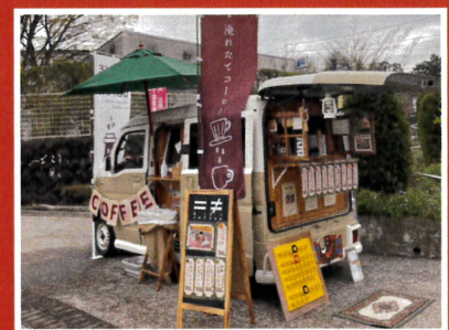
niki coffee (コーヒー屋)