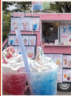
CoCoA (パフェ・チュロス)