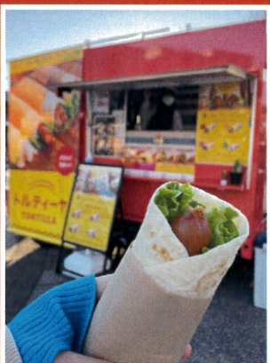
SUSUN CAR KITCHEN (トルティーヤ・フリト)