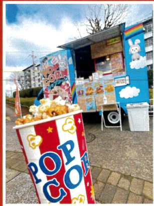
わんらびっと (ポップコーン他)