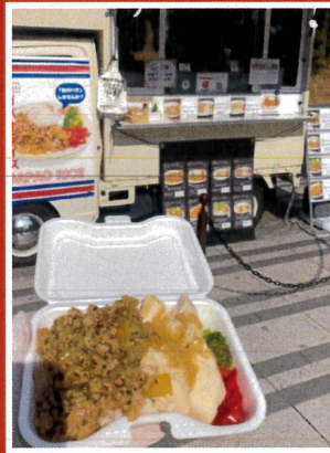
Hagi's Kitchen (ガパオライス)