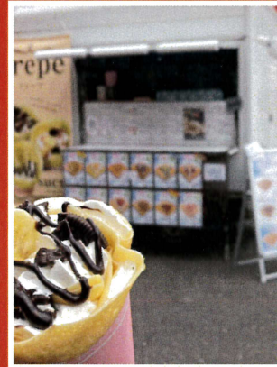
crepe sucre (クレープ)