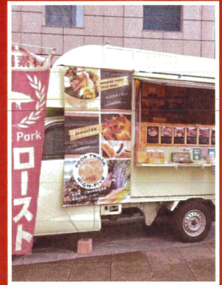
FOOD TRUCK High-Five (ローストポーク丼)