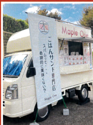
Maple One (スパムごはんサンド)