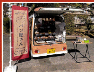
バニヤンツリーベーカリー (パン屋)