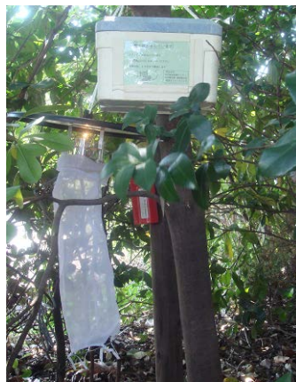
蚊捕獲用トラップ