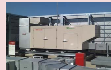
自家発電用発電機（屋上）