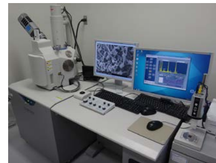
異物検査（走査型電子顕微鏡）

井戸水やビル・マンションの飲み水、プール・浴槽水などの身近な水の衛生に関する検査・研究及び建材や家具、塗料などから放散されシックハウス症候群の原因となるホルムアルデヒドなどの室内空気中の有害物質に関する検査・研究を行っています。また、食品中に含まれる放射性物質に関する検査・研究を行っています。