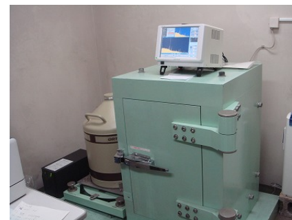
放射能検査（γ線核種分析装置）