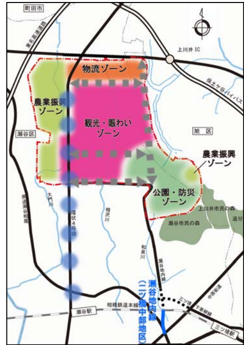
【旧上瀬谷通信施設土地利用基本計画(土地利用ゾーン)】