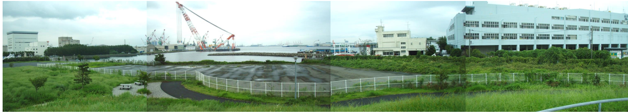
【杉田臨海緑地整備工事】