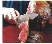
2F シュラスコ&ビアレストラン ALEGRIA