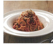
2F イタリアン リトラーネオ