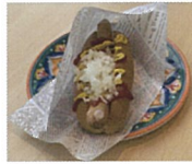
3F カフェ・市政刊行物・グッズ販売 marine blue