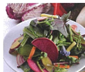
2F お肉料理と横浜野菜 TSUBAKI食堂