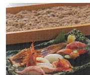
2F 寿司と山形蕎麦 海風季