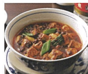
2F 本格四川料理 成都 陳麻婆豆腐