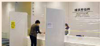
※議会局、市会にご用のある方は、3階議会受付にお越しください。

3階市役所受付にて、訪問先の「局・課名」または「階」を伝え、入館証を受け取ります。なお、記名や身分証の提示などは不要です。