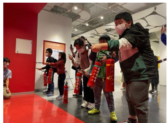
小学校向け防災体験ツアーの様子 (横浜市民防災センター内)