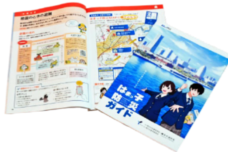
はまっこ防災ガイド