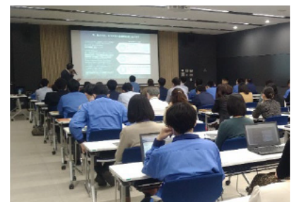
行政運営の基本方針 各区役所説明会の様子