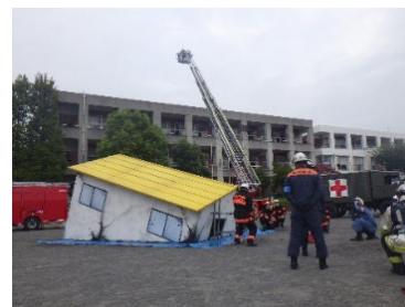
総合防災訓練の様子

横浜市総合防災訓練（九都県市合同防災訓練）、 「防災とボランティアの日」防災訓練（図上訓練）等、 関係機関と連携した各種訓練を実施し、あらゆる災 害に備えます。