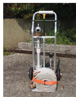
スタンドパイプ式 初期消火器具