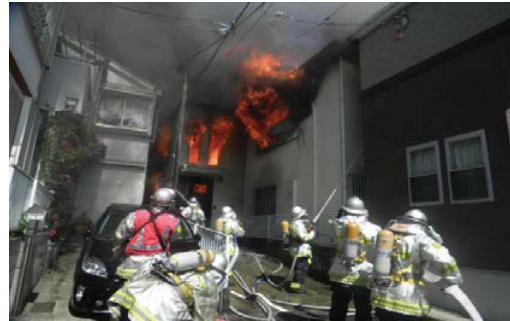
火災現場における消火活動