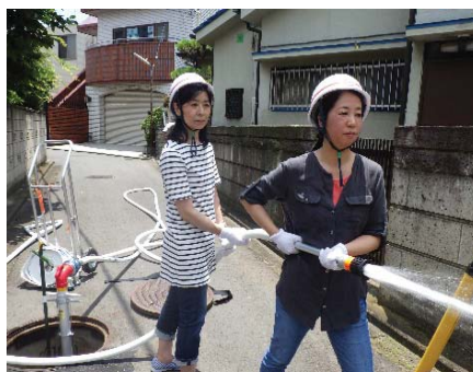
地域住民による初期消火訓練

(初期消火器具等補助 概要) 補助率：3分の2(上限20万円) 補助数：100基