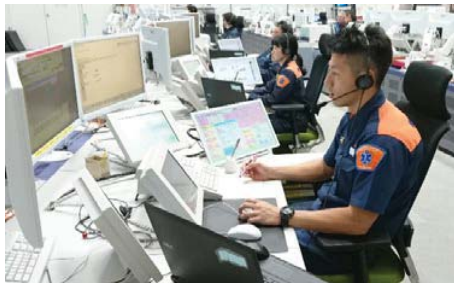
消防司令センター

また、音声によらない緊急通報を行うことができる「Net119緊急通報システム」の運用を開始し、聴覚・言語に障害がある方などからの119番受信体制を強化します。