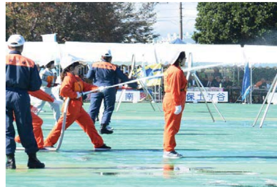
自 衛 消 防 隊 操 法 訓 練