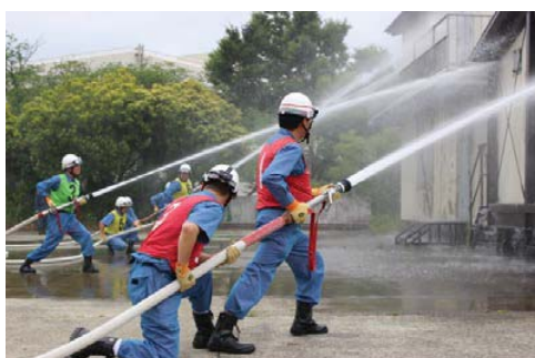
消防団放水活動訓練