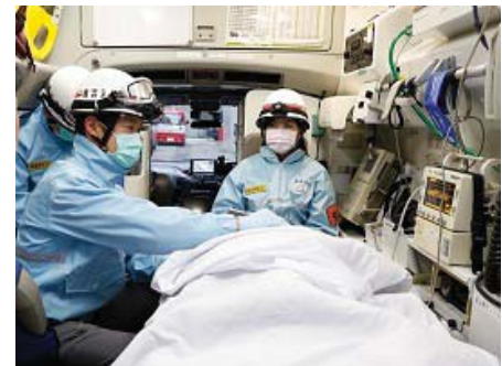
救急車内での活動状況

また、メディカルコントロール体制を確保するほか、横浜市救急業務検討委員会や横浜市メディカルコントロール協議会を開催し、外部機関の意見を踏まえ、救急活動の充実強化に取り組みます。