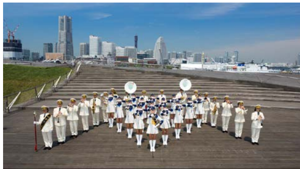
音 楽 隊 の 隊 列