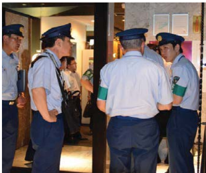
一 斉 夜 間 査 察