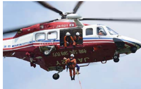
消防ヘリコプター