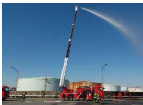
石 油 コ ン ビ ナ ー ト 区 域 で の 事 業 所 の 訓 練