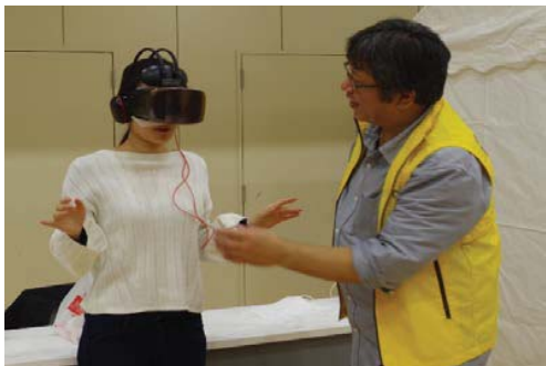
V R 体 験

さらに、防災指導や防災訓練、ホームページでの広報、音楽隊による防災ふれあいコンサート等の様々な機会を通じて防災・減災を積極的に啓発し、市民の防火・防災意識の高揚を図ります。