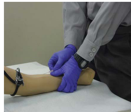
救急救命処置に係る手技訓練 ( 静脈路確保 )

また、高規格救急車を配置して救急事案出場時に医師が同乗することで、医師による現場指示や指導が可能となり、効果的な教育が実施できます。