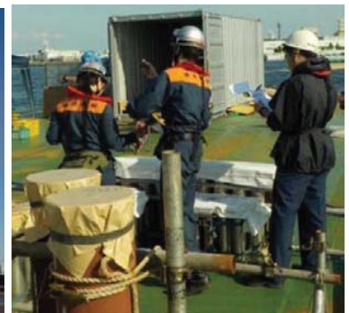
火 薬 類 検 査