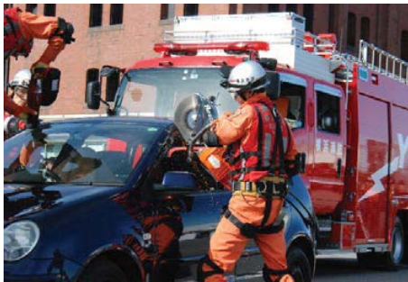
資機材を活用した救出訓練

また、東京2020大会に向け、他機関との連携を強化し、あらゆる災害に対応できる体制を確保するなど、災害活動体制の充実強化を図ります。