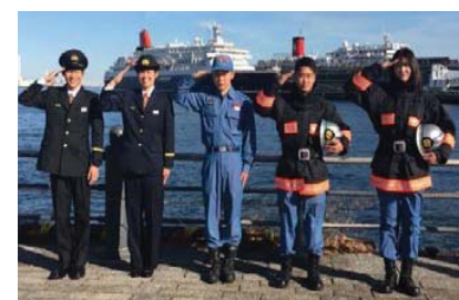
消防団員防火衣等