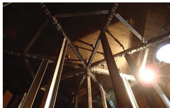
防火水槽補強工事