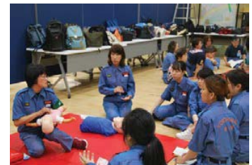
消防団員活動状況