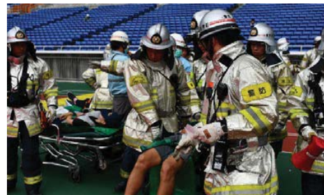
多数傷病者発生事案の活動状況