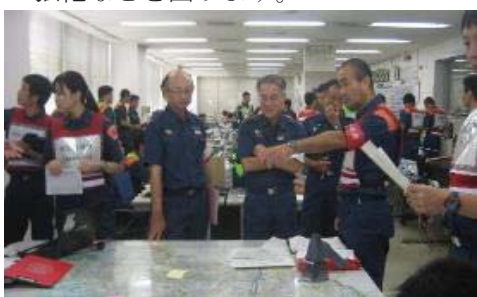
消防本部内の情報収集活動状況

災害発生時、競技会場の現地本部と消防局の警備本部間において、迅速・的確に災害情報等を収集し共有するための資機材（携帯電話、タブレット端末等）を整備し、指揮機能の強化などを図ります。