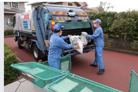
家庭ごみ収集作業の様子