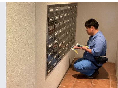
ポスティングの様子