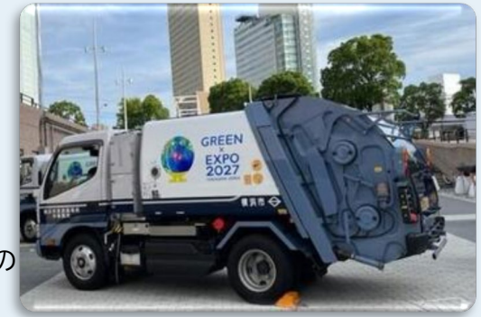
横浜グリーンエキスポのラッピング収集車