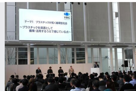
プラットフォームによる マッチングイベントの様子