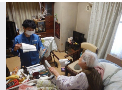
ふれあい収集の実施に向けた面談