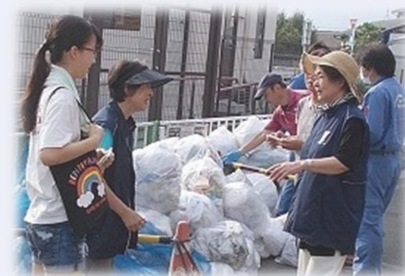
環境事業推進委員と集積場所啓発の様子