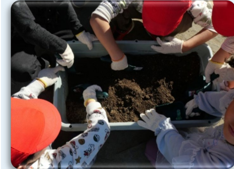
堆肥づくりに取り組む子どもたち

市内の学校で子どもたちが生ごみを土壌混合法で堆肥化し、会場の花壇で活用します。また、会場アクセス駅の公衆トイレを改修するとともに、ラッピング収集車やイベント啓発等あらゆる機会を活用し、成功に向けた機運醸成を図ります。