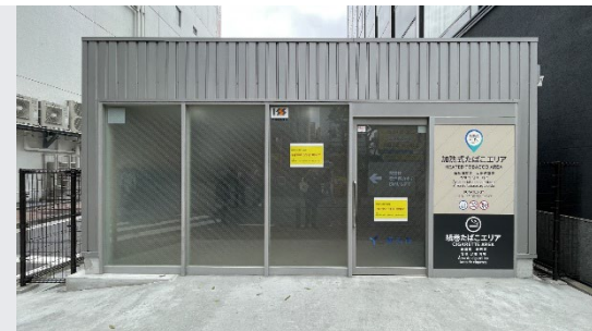
4月15日に開所した横浜駅西口北幸喫煙所