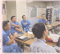
プラスチック資源分別定着PJの打合せの様子

職員がいつでも気軽に相談でき、自由に意見を言い合える「場」をつくります。部署を超えた活発なディスカッションを通じて、一人ひとりの能力やアイデアを最大限に引き出します。