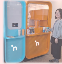
【市役所プラチャレンジ】日本初！リユースカップ式自動販売機

責任職は、職員が働きやすく、挑戦しやすい職場づくりの要として役割を果たします。職員が仕事に魅力ややりがいを見出せるよう、組織として失敗を恐れず、新たなチャレンジを促します。