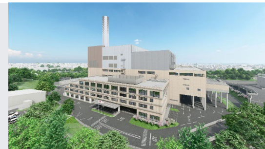
保土ヶ谷工場の完成イメージ図