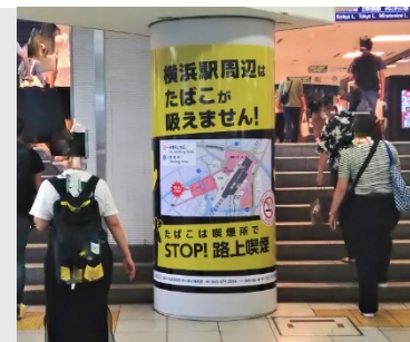
路上喫煙対策で過去に実施した駅広告