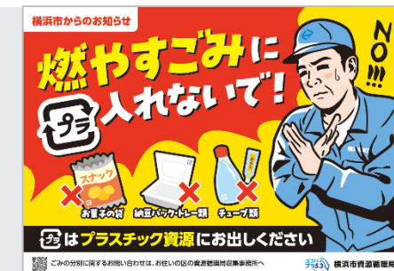
集積場所での広報物