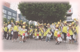
区役所や事業者と連携した清掃活動

社会的課題の解決には、局内での部署連携や区局の連携が不可欠です。当局職員一人ひとりが連携の大切さを認識し、互いの知見や視点を尊重する中で新たな気づきを得ながら、チームとして力を発揮していきます。