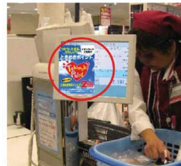
レジ横サイネージ(イメージ)