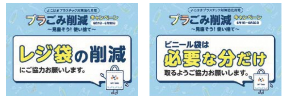
▲ポップデザイン(例)

プラスチックによる環境汚染の現状や、使い捨てとなるワンウェイプラスチックの削減に向けて取り組んでいただきたいことを、わかりやすくお伝えするポスター、ポップを掲示します。(ポスターデザインは別添のとおり)