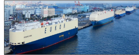
【自動車専用船で賑わう大黒ふ頭】