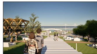
【臨港パーク（キング軸接続部）整備イメージ】