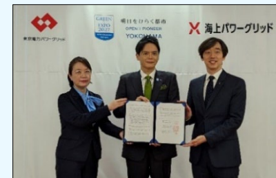
【覚書締結式のロゴ】