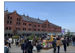
【民間事業者によるイベント（赤レンガ倉庫）】