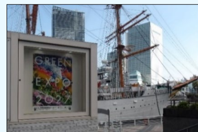
【帆船日本丸のポスター展示】