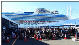
【大型クルーズ船の下船の様子】

安全かつ円滑なクルーズ船の受入れを行うとともに、⑤大さん橋国際客船ターミナルでは、空調・照明設備等の大規模改修に着手します。また、「世界に誇れる水際線」の実現に向けて、みなとみらい21地区において、⑥臨港パークや自動車等の再整備などに取り組むとともに、民間事業者による賑わい施設の導入や様々なイベントを連携させた回遊促進に取り組めます。船齢96年を迎えた国指定の重要文化財である⑦帆船日本丸については、甲板の一部張替え等を行います。⑧山下ふ頭再開発は、新たな事業計画の策定にあたり、引き続き、市民の皆様のご意見を伺う機会を設け、市民意見を反映したまちづくりを進めていきます。