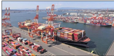
【南本牧ふ頭に着岸する世界最大級のコンテナ船】

さらに、国や民間事業者とともに、物流の様々な分野においてDXを導入し、生産性の向上や快適な労働環境に向けた改善等を推進するとともに、港湾の整備や管理において業務効率化とコスト縮減に取り組みます。