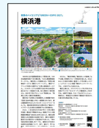
【クルーズ船情報誌への寄稿】