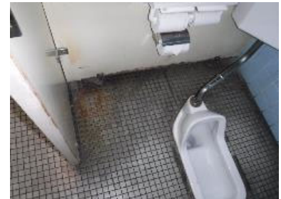
手洗所 老朽化状況