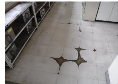
事務室前廊下仕上不良