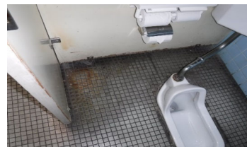
手洗所 老朽化状況