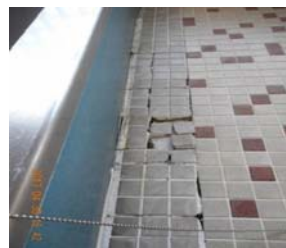
浴室床タイル破損