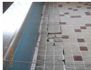
浴室床タイル破損