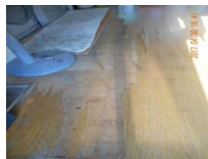
脱衣室床仕上不良