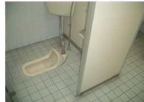
営業所トイレ状況