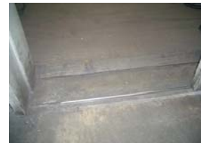
工場事務室床状況