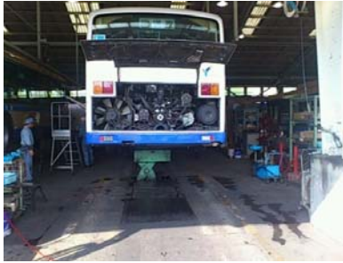
港北営業所既存リフト