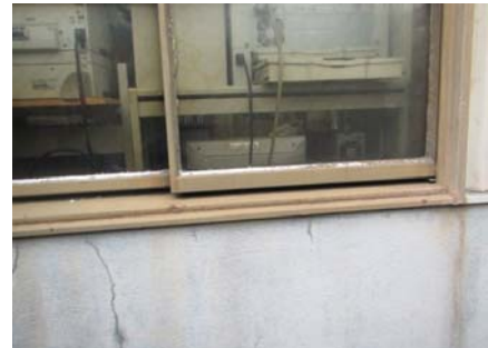
工場外部サッシ老朽化状況