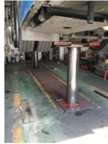
整備例(浅間町営業所)