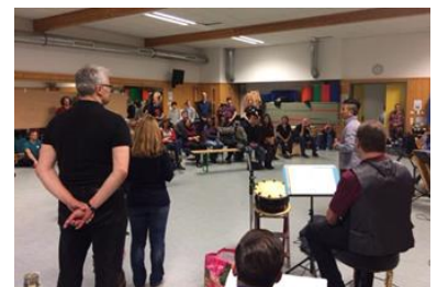
（ワークショップの様子）