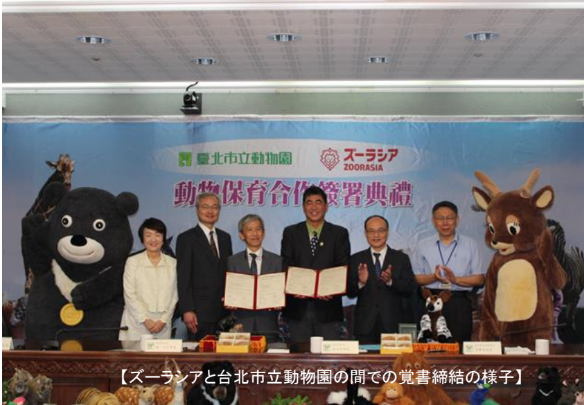
【ズーラシアと台北市立動物園の間での覚書締結の様子】

平成 28 年 10 月 31 日 【発行】横浜市国際局政策総務課 企画担当 045-671-3826 ki-somu@city.yokohama.jp