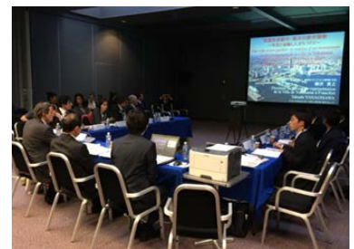
(プレゼンテーションの様子)

横浜市からはフランクフルト事務所長が参加し、「横浜の環境に配慮した持続可能な都市開発や市民の皆さまと協働した街づくり」についてプレゼンテーションしました。