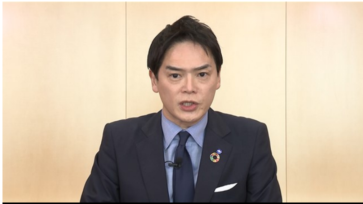
【国際市長フォーラムにおいてビデオメッセージでの山中市長による登壇の様子】

Yokohama International Affairs Bureau, General Division 企画担当 (Inquiries) 045-671-4700・ki-somu@city.yokohama.jp